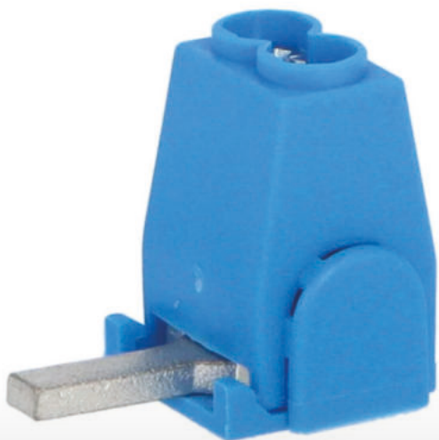
Připojení do přístrojů pomocí konektoru kolík (jazýček)