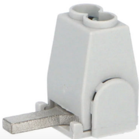
Připojení do přístrojů pomocí konektoru kolík (jazýček)