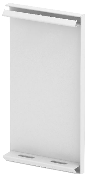
Koncový díl ke kanálům pro vestavbu přístrojů GS.