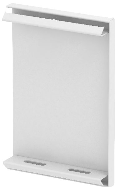
Koncový díl ke kanálům pro vestavbu přístrojů GS.