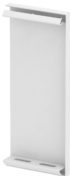
Koncový díl ke kanálům pro vestavbu přístrojů GS.