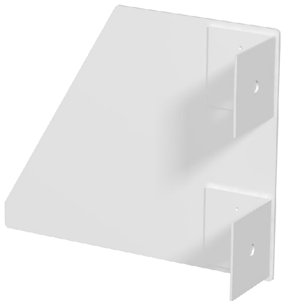
Koncový díl pro kanál pro vestavbu přístrojů GEK-S