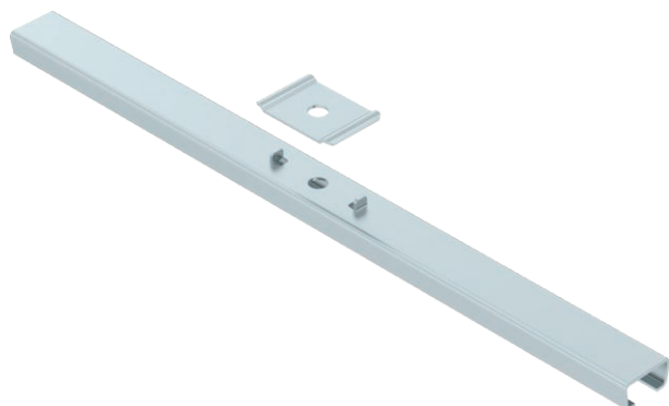
Středový závěs pro mřížové žlaby.