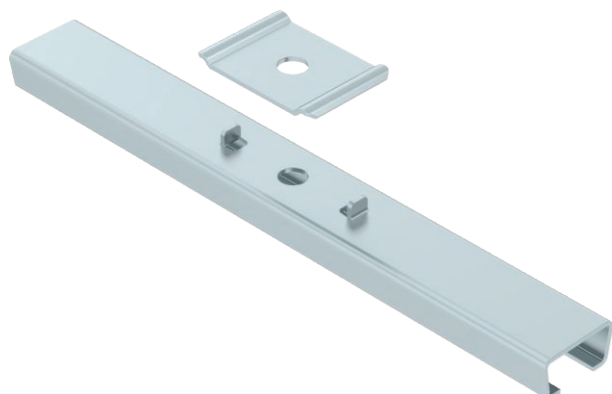
Středový závěs pro mřížové žlaby.