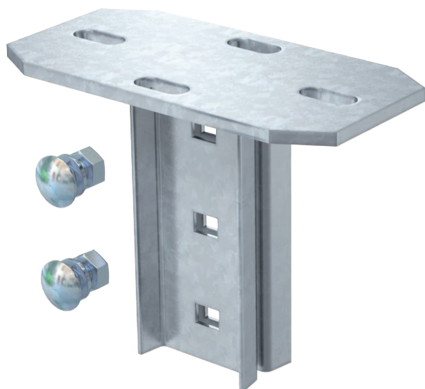
Základová deska pro montáž na závěs IS 8.