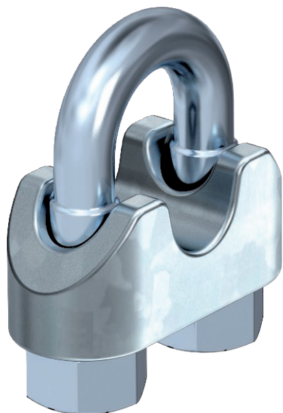
Svorka spojovací pro ocelová lana 6 mm