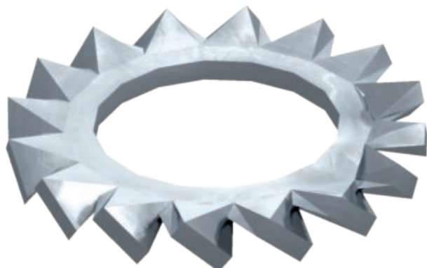
Vějířová podložka podle DIN 6798, tvar A.