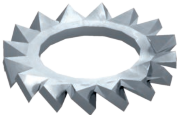
Vějířová podložka podle DIN 6798, tvar A.