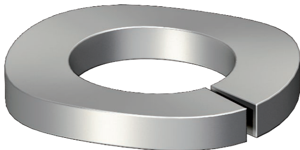
Pérová podložka tvar A dle DIN 128.