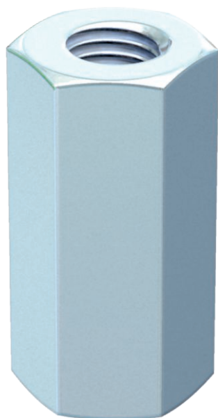
Spojka s průchozím vnitřním závitem.