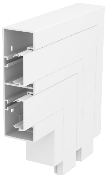
Plochý roh pro změnu směru kanálů pro vestavbu přístrojů Rapid 45-2.