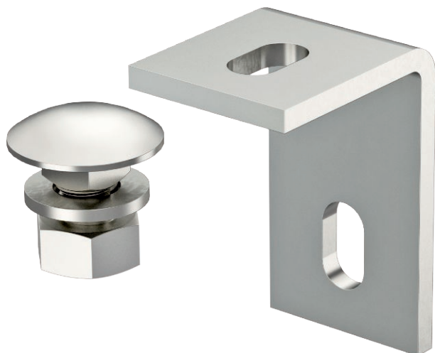
Upevňovací úhelník 70 x 50 mm.