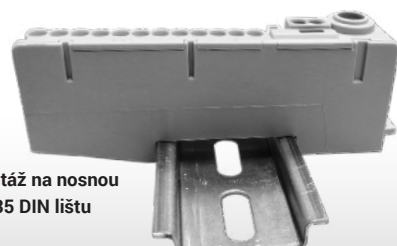
Montáž na nosnou TS-35 DIN lištu