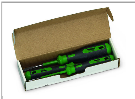
BSet of operating tools in a box