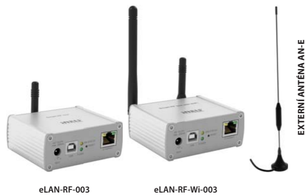
EXTERNÍ ANTÉNA AN-E