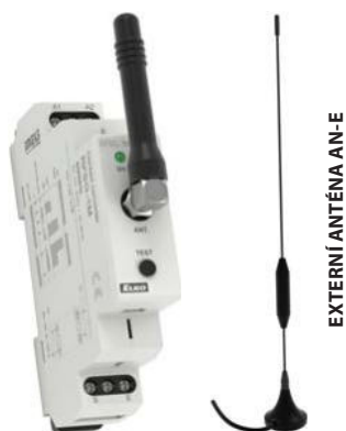
EXTERNÍ ANTÉNA AN-E