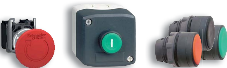
vybrané ovládací prvky Harmony