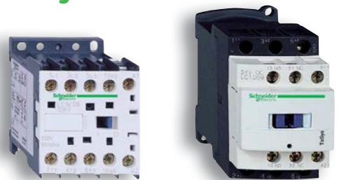
vybrané ministrykače TeSys