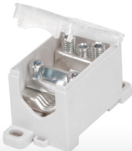
PVB 250-3 Vstup