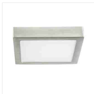
KANTI V2LED 18W-NW-SN