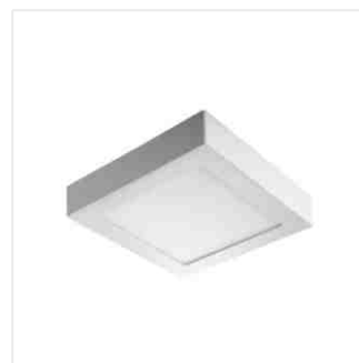
KANTI V2LED 18W-NW-W