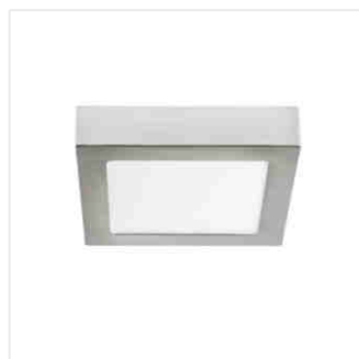
KANTI V2LED 12W-NW-SN