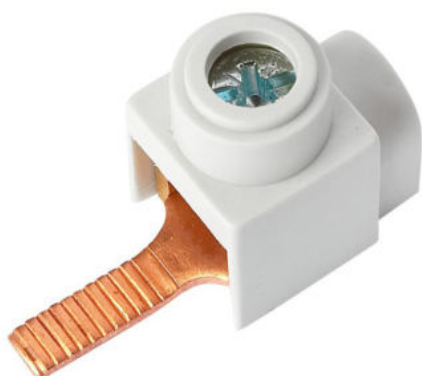
Připojení do přístrojů pomocí konektoru kolík (jazýček)