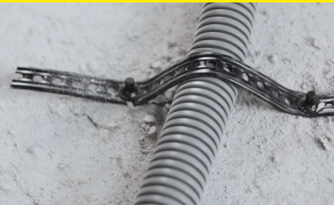
Montážní páska - MP