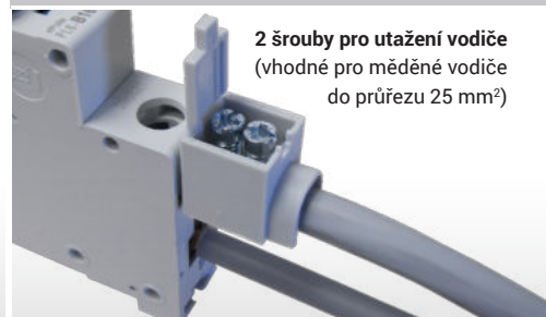
2 šrouby pro utažení vodiče (vhodné pro měděné vodiče do průřezu 25 mm 2 )