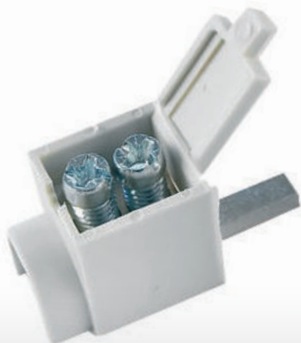
Připojení do přístrojů pomocí konektoru kolík (jazýček)