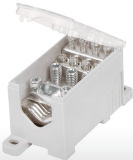
PVB 250-3/8 Vstup