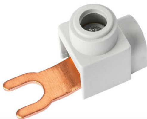
Připojení do přístrojů pomocí konektoru vidlička