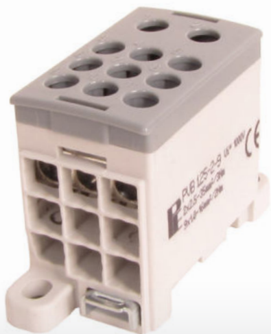
PVB 125-2-9 Vstupy