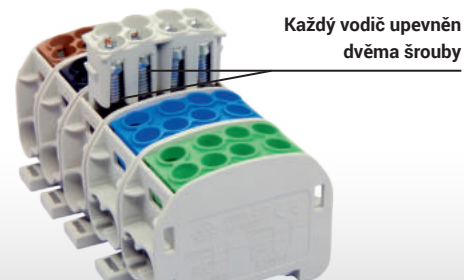
Každý vodič upevněn dvěma šrouby