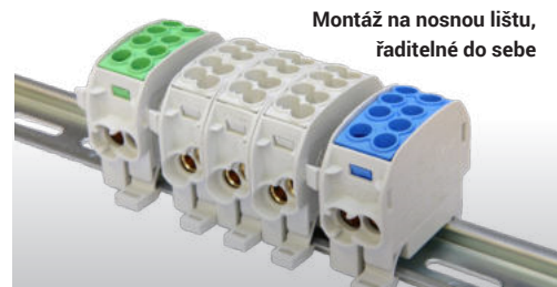
Montáž na nosnou lištu, řaditelné do sebe