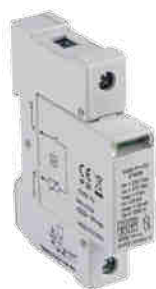
KSD-T2 275/40 1P