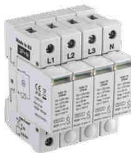
KSD-T2 275/160 3P+N