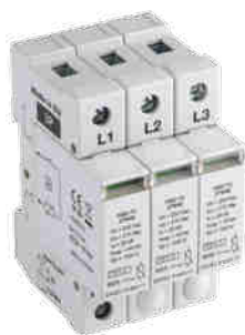
KSD-T2 275/120 3P