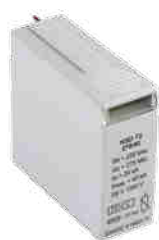
KSD-T2 275/40 M