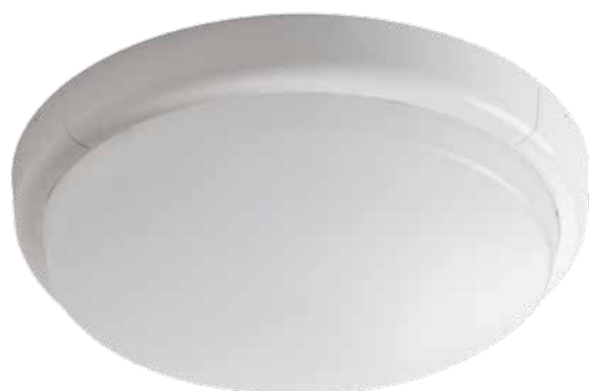
● DUNO LED N24W-NW-O