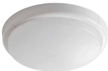
● DUNO LED N15W