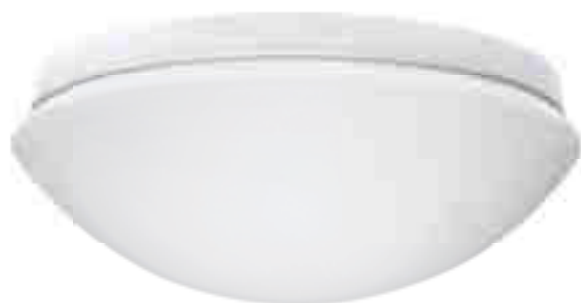
PIRES DL-600 NS