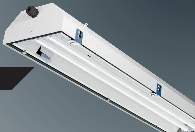
PITBUL-Ex, 4x58W, IP65

NEREZ – těleso vyrobeno z nerezového plechu