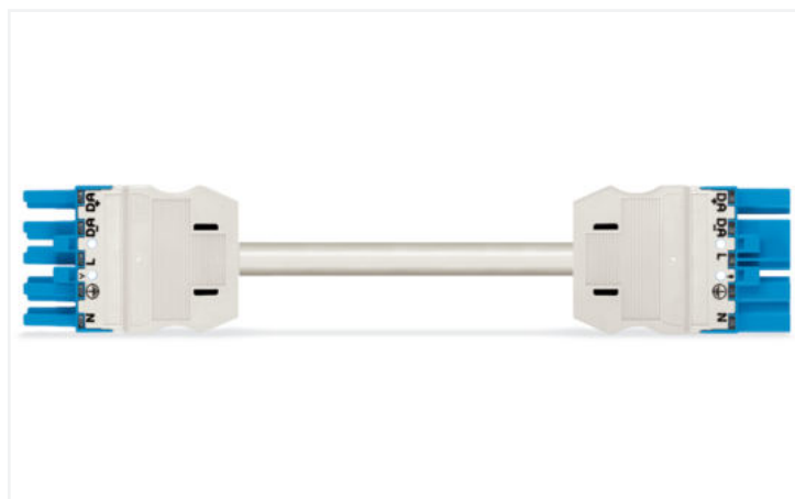
Barva: ■ Modrá