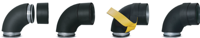
postup při instalaci pásky