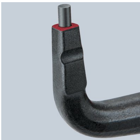
Stabilní nasazené hroty z vysoce legované pružinové oceli