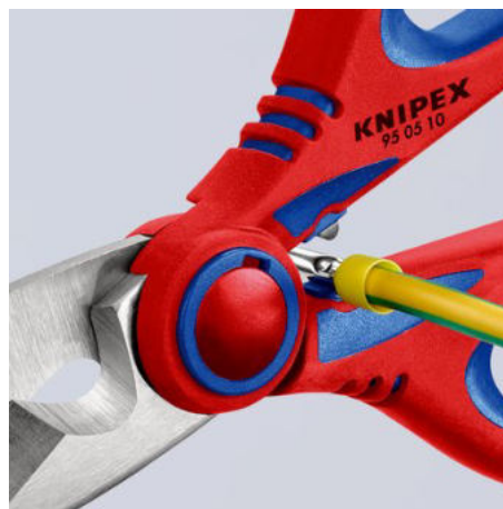
Rychlé, jednoduché lisování