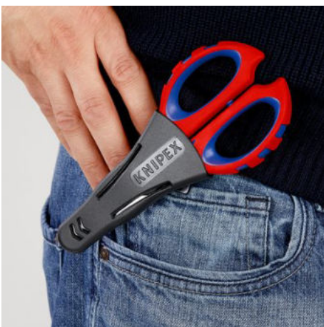
!Sicher verstaut und immer griffbereit!