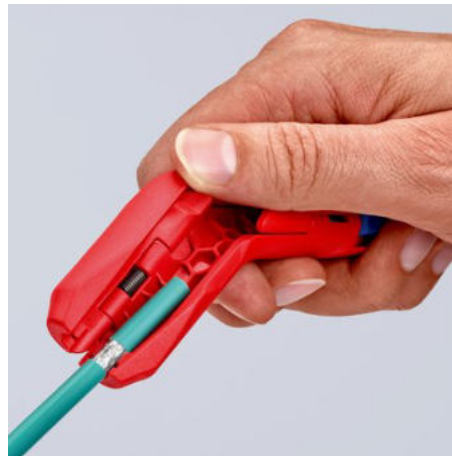
Odizolování datového kabelu