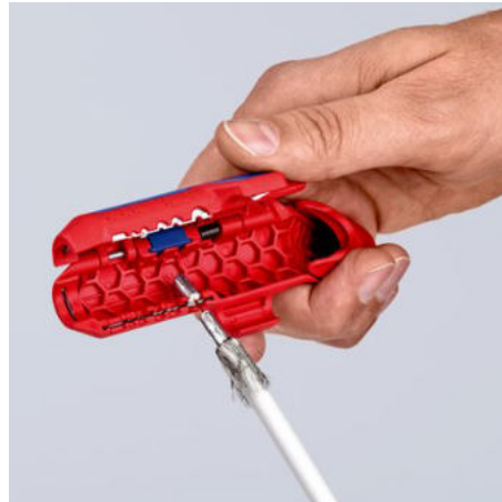
Odizolování koaxiálního kabelu