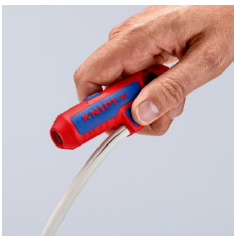
Se zakrytým nožem v bočně vyčnívající podložce pro palec pro komfortní podélný řez