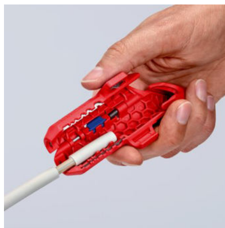
Odizolování kabelu NYM