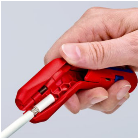
Odizolování koaxiálního kabelu