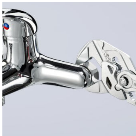
Práce s chromovanými armaturami bez poškození povrchu