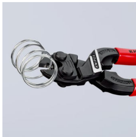
Výkonné až do hrotů