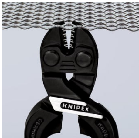
Úzká hlava pro optimální přístup