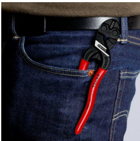
Kompaktní, lehké a vždy po ruce