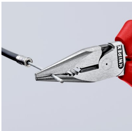
Vyfrézovaná drážka v oblasti uchopení