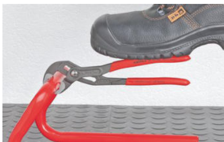
Zuby přesazené proti směru otáčení způsobují samosvorný efekt a zabraňují sklouznutí po obrobku.