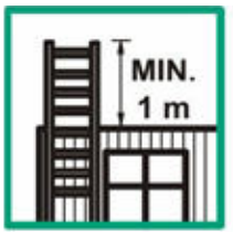
Presah rebríka nad miestom dotyku