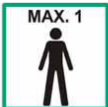
Maximálny počet užívateľov na rebríku