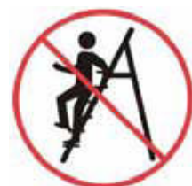
Pri nastupovaní a vystupovaní byť vždy obrátený tvárou k rebríku