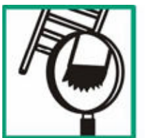
Kontrolovat patky žebříku