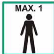
Maximální počet uživatelů na žebříku