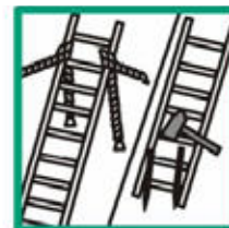
Zabezpečiť horný / dolný koniec rebríka