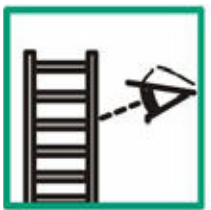
Vizuálna prehliadka pred použitím