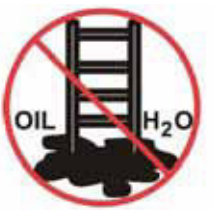
Zabezpečiť, aby bol podklad bez nečistôt