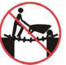
Nepoužívať rebrík ako most