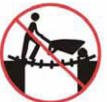
Nepoužívat žebřík jako most