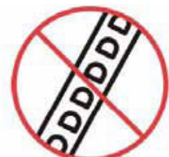
Používat žebřík vhodným způsobem