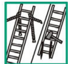
Zajistit horní / dolní konec žebříku