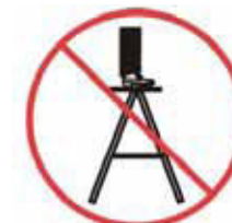
Nestát na horním stupadle