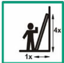
Vhodný uhol postavenie rebríka