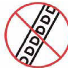
Používať rebrík vhodným spôsobom