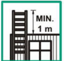
Přesah žebříku nad místem dotyku