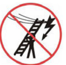
Uvedomiť si nebezpečenstvo elektrického prúdu pri prenášaní rebríka