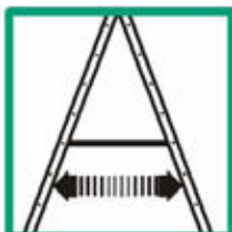
Zajistit, aby dvojitý žebřík byl před použitím vždy zcela rozevřen