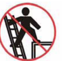
Nevstupovať mimo rebríka