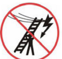
Uvědomit si nebezpečí elektrického původu při přenášení žebříku