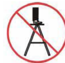
Nestáť na hornom stupadle