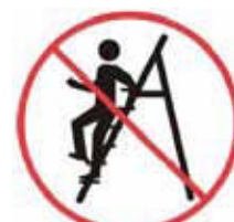
Při nastupování a vystupování být vždy obrácen tváří k žebříku