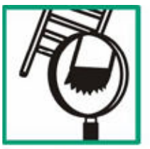
Kontrolovať patky rebríka