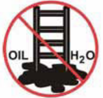
Zajistit, aby byl podklad bez nečistot