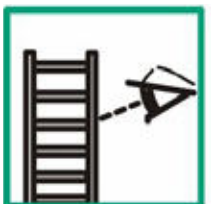
Vizuální prohlídka před použitím