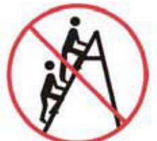
Pouze jedna osoba na výstupním rameni žebříku / příčkového žebříku