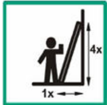
Vhodný úhel postavení žebříku