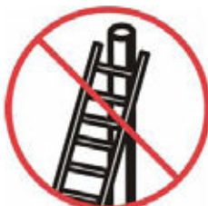
Zajistit, aby horní konec žebříku byl vhodně postaven