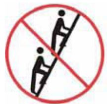
Iba jedna osoba na výstupnom ramene rebríku / priečkového rebríka