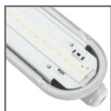
wydajne źródła światła LED