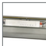
izolowany układ zasilania