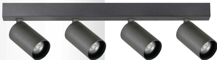
LED COIN 50 COB B

svítidlo pro stropní i nástěnnou montáž • LED zdroj COIN 50 COB • otočné o 355° a výklopné do 90° • těleso z hliníkového profilu • volitelné barevné provedení • volitelná barva kroužku COIN 50 COB černá nebo bílá • zdroje jsou součástí svítidla • střední dimenzovaná životnost svítidla 50 000h L70/B50 při Ta = 25°C • barevná odchylka MacAdam 2 SDCM • kombinace chromatičnosti, úhlů, příkonu a CRI možná