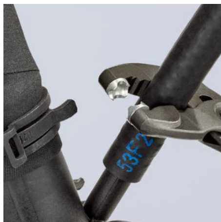
doplňková funkce: šetrné povolování hadic díky ozubené uchopovací čelisti